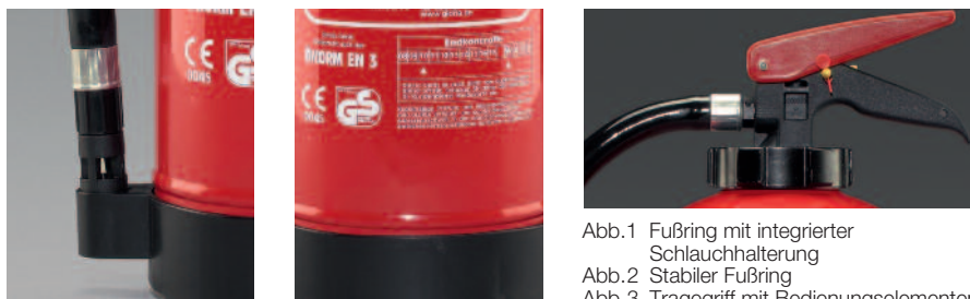
Abb.1 Fußring mit integrierter Schlauchhalterung Abb.2 Stabiler Fußring Abb.3 Tragegriff mit Bedienungselementen